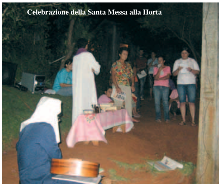
Celebrazione della Santa Messa alla Horta

Così, mentre la musica creava l'atmosfera giusta richiamando l'attenzione della popolazione, ci siamo organizzati dividendoci a due a due e portando con noi l'acqua benedetta e uno schema di preghiera. Come concordato, dopo la visita alle famiglie, su un altare improvvisato di fronte a una casa, quasi in mezzo al sentiero, si è svolta la celebrazione della S. Messa mentre di fronte ai nostri occhi continuavano a svolgersi scene di vita quotidiana.