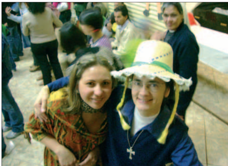
Festa Giunina a Tamarana