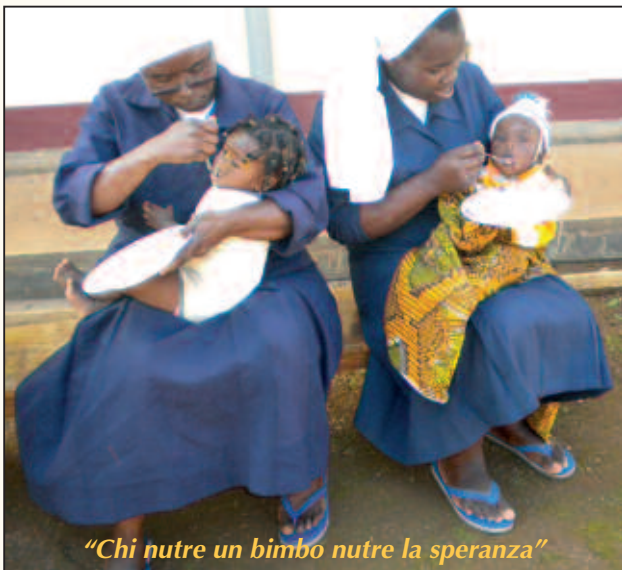
"Chi nutre un bimbo nutre la speranza"

Ogni anno il resoconto. La Famiglia, tramite le suore missionarie, amministra le offerte, ne dà un rendiconto annuale, s'impegna a fornire una scheda del bambino, con i suoi dati anagrafici, indirizzo della missione che lo assiste, foto e quanto altro può favorire la sua conoscenza, insieme ad aggiornamenti sulla sua situazione che le missionarie invieranno all'ufficio.