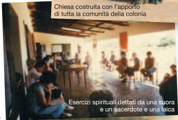
Esercizi spirituali dettati da una suora e un sacerdote e una laica