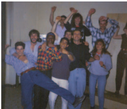
Fine del corso d'italiano... ma non dell'amicizia

Padre Miguel ci regalò una Bibbia latinoamericana nella quale trovammo una pagina con la foto di una donna povera e anziana,