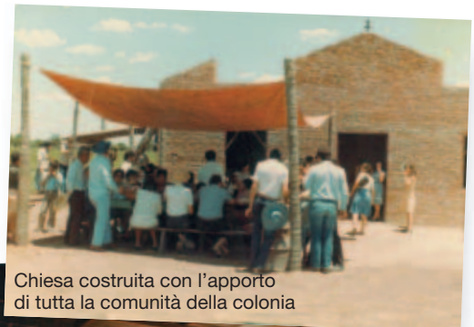
Chiesa costruita con l'apporto di tutta la comunità della colonia

Di cristiani in missione così ce ne sono a tutte le latitudini ma pochi di loro sono conosciuti, sono come semi del regno nascosti nella nostra madre terra che poi un giorno grazie a loro si trasformerà in cielo. [ndr.]